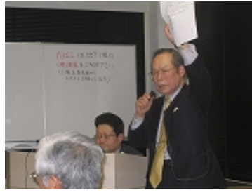
写真 9 河内経営工学部会長