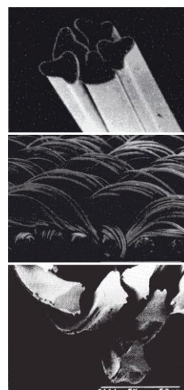
図1, 2, 3

絹鳴り音についても、ポリエステルの三角断面形状繊維の頂点に微細スリットを入れた、三花弁断面繊維の実現により複雑なスティックスリップ現象を生じさせることで実現した。(図3)