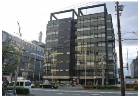
京都リサーチパーク 4号館